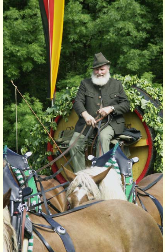
Urgestein auf dem Kutschbock