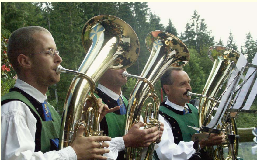
Zünftige Musi fehlt nie in Bayern

Festtagsgeschirr bis hin zu sauber zum Zopf geflochtenen Pferdeschwanz und der sorgfältig und würdevoll herausgeputzten Mähne. Von den üppig mit Blumen dekorierten Wagen und Kutschen, den Chaisen und Landauern einmal ganz abgesehen. Auch das einheimische Publikum ist dem Anlass entsprechend zünftig gekleidet. Applaus brandet auf, wenn der Zug aus mehr als 200 Pferden vorbei defiliert. Begleitet von verschiedenen Trachtengruppen, die gemeinsam mit einigen Spielmannszügen für zusätzliche, festliche Stimmung sorgen und mit ihren typischen Rhythmen vom Hufgetrappel ablenken. Auf der Festwiese dann führen alle Teilnehmer ihre Tiere und Gespanne nochmals vor. Hier kommt jedes Ensemble, jeder prachtvoll geschmückte Vierbeiner erst richtig zur Geltung. Das gilt natürlich auch für die stattlichen, manchmal rauschbärtigen Kutscher auf ihren Böcken. Kleine Almkarren bejubeln und feuern die Zuschauer, die an zünftigen Biertischen sitzen oder alles vom Rand der Pferdearena beobachten,