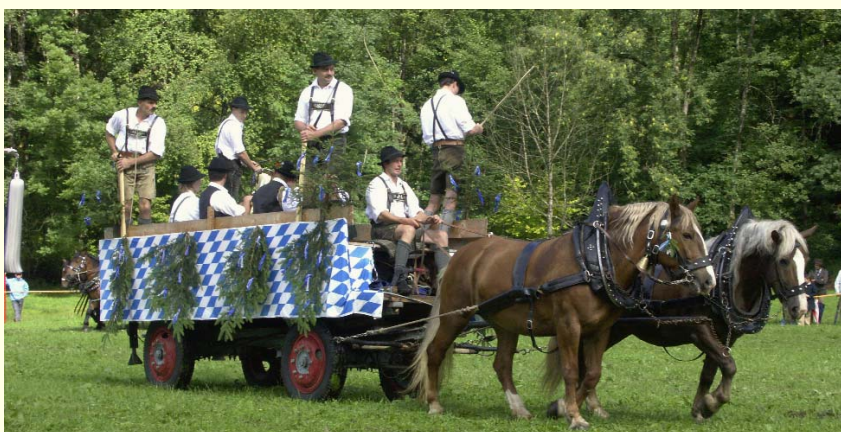
Die typisch bayrische Note