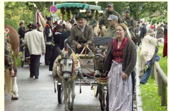
Ross und Rösslein