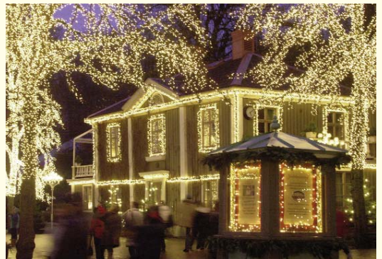
Lichtermärchen in Liseberg