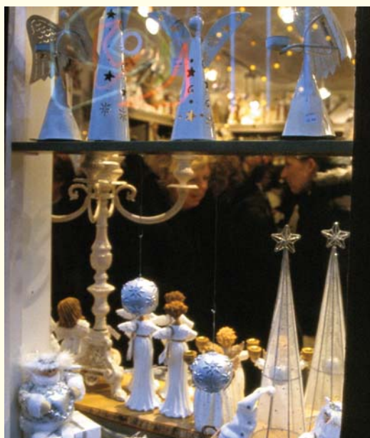
Kunsthandwerk und anderes