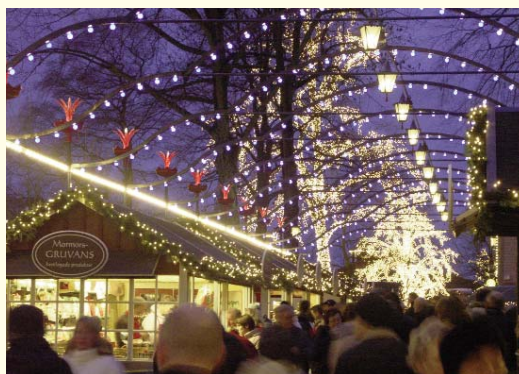
Krämerläden und Buden