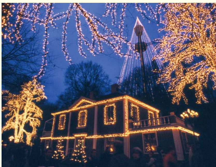
Faszination "Licht" im dunklen Norden