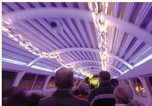
Einstimmung auf den Überwegen