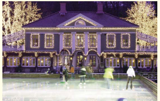
Romantische Kulisse zum Schlittschuhlaufen